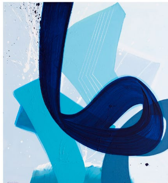
Aatifi – Magie der Abstraktion

@ Atelier Aatifi | Kunsthandel Müller-Heid