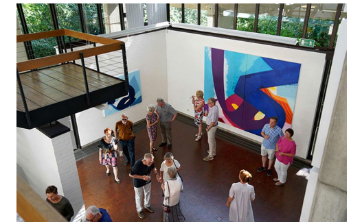
Aatifi – News from Afghanistan, Einzelausstellung im Museum für Islamische Kunst im Pergamonmuseum, Berlin, 2015